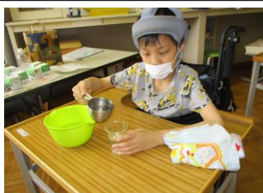
計量カップの利用体験

自立に向けて、家庭の役割や栄養素の知識などについて学習しました。感染症対策のため試食はできませんでしたが、シャーベット作り体験を行いました。