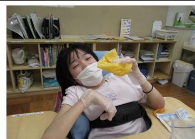
シャーベット作り体験②