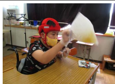
シャーベット作り体験①